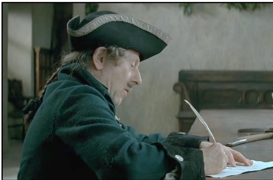
Kadr filmowy nr 1

Obejrzyj poniższe kadry filmowe z ekranizacji Zemsty w reżyserii Andrzeja Wajdy i przeczytaj zamieszczone pod nimi fragmenty utworu Aleksandra Fredry.