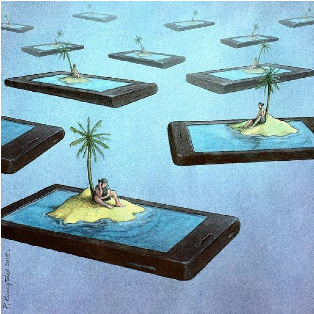
Paweł Kuczyński, Wyspy , www.digitalyouyh.pl

Czy grafika Pawła Kuczyńskiego mogłaby być ilustracją do tekstu Pochwała przyjaźni ? Uzasadnij swoją odpowiedź.