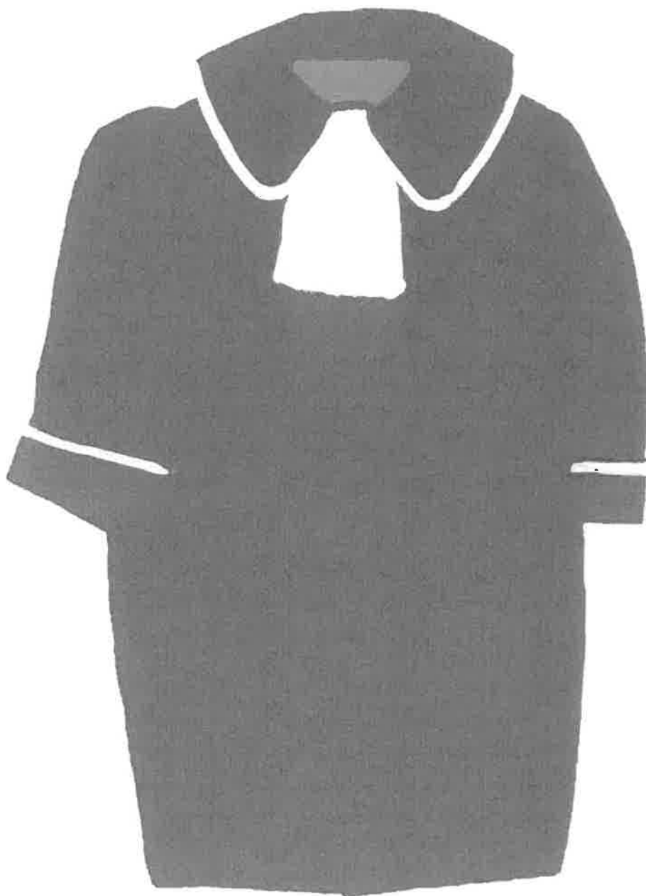
widok z przodu