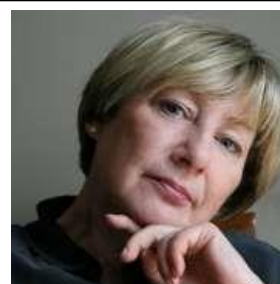
Ewa Lipska (ur. w 1945 r.) – poetka i felietonistka.

Mogę być sobą i sterować nocą by się w nietrwale nie zapuszczają lądy i pustej doby nie trzymać w ramionach. Myśli powtarzać by zostały po nas znowu dla kogoś. Dla tych samych odkryć.